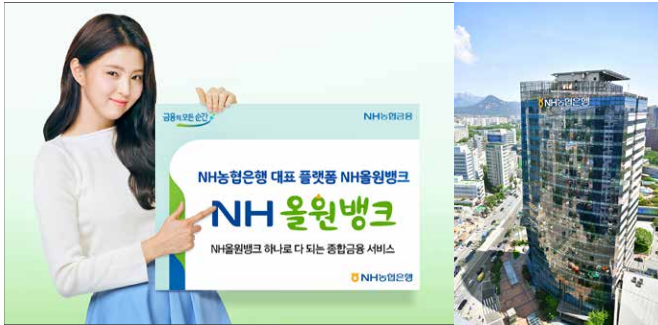
NH농협은행 사옥 전경

NH농협은행은 2022년 전략 목표인 '고객 중심 초 혁신 디지털뱅크' 도약을 위해 디지털 전환에 박차를 가하고 있다. 이를 위해 NH올원뱅크 내 금융계열사의 핵심 서비스를 연계해 계열사 간 장벽을 없앤 종합 금융 플랫폼을 선보였다. 우선 하나의 애플리케이션에서 은행, 보험, 증권 등 종합 금융 서비스는 물론 생활과 밀접한 각종 서비스를 통합해 제공한다.