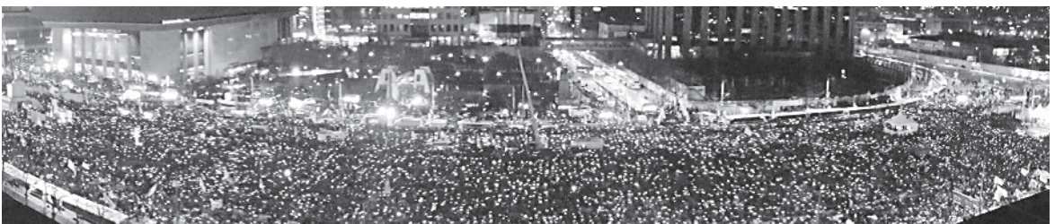
▲ 2월 25일 오후 서울 광화문에서 열린 제17차 박근혜 대통령 퇴진촉구 집회에서 참가자들이 구호를 외치고 있다.

2016년 10월 29일 시작된 촛불집회의 열기는 국회에서 박근혜 대통령에 대한 탄핵소추안이 가결된 이후에도 사그라지지 않았다. 2017년 1월 7일, 새해 들어 처음 열린 광화문 촛불집회에는 주최 측 추산 64만 명이 참가했고, 2월 25일 열린 17차 촛불집회에는 주최 측 추산 107만 명이 참가했다.