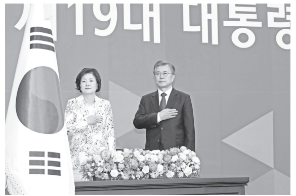
▲ 문재인 대통령과 김정숙 여사가 5월 10일 오후 제19대 대통령 취임식이 열린 국회 로텐더홀에서 국민의례를 하고 있다. 취임식에는 5부 요인과 국회의원, 국무위원, 군 지휘관 등 300여 명이 참석했다.

문 대통령은 국회의사당 로텐더홀에서 정세균 국회의장에게 취임 선서를 하고, '국민께 드리는 말씀'을 낭독했다. 그는 “오늘부터 저는 국민 모두의 대통령이 되겠다. 저를 지지하지 않았던 국민 한분 한분도 저의 국민이고 우리의 국민으로 섬기겠다.”라며 “2017년 5월 10일 이날은 진정한 국민통합이 시작된 날로 역사에 기록될 것”이라고 선언했다. 또 “빈손으로 취임하고 빈손으로 퇴임하는 깨끗한 대통령이 되겠다.”며 “훗